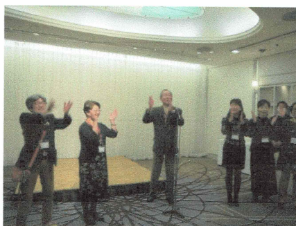
【懇親会での中締め】