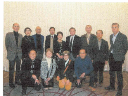
【旧運営委員の皆さん】