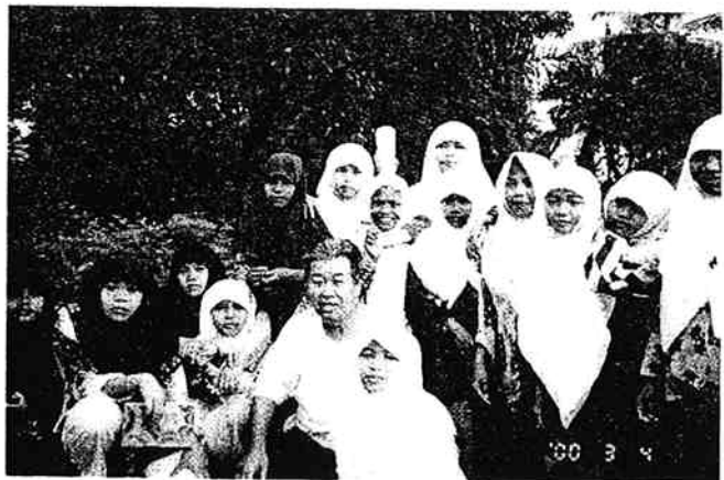
バリ島で日本語を勉強しつつ滞在者のお世話をするボランティアスタッフ。