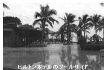
ヒルトンホテルのプールサイド

お終りに、4年間ご支援いただいた会員の皆様、及び会の発展に向け快くサポートいただきました運営委員会構成メンバーの一人一人に心より感謝の念を捧げます。