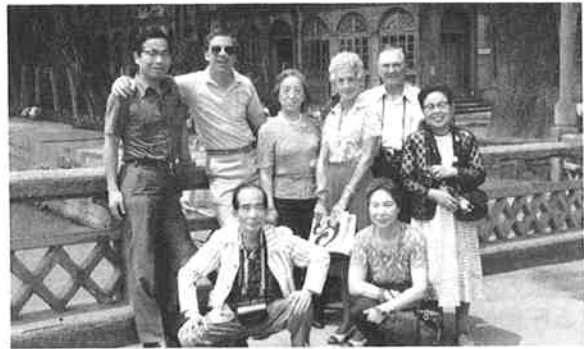
若き日、ローマにて（後列左端が筆者）

香港から列車で深圳を経由し広州に入り、桂林、上海そして北京へと和気あいあいの旅を続けて行き