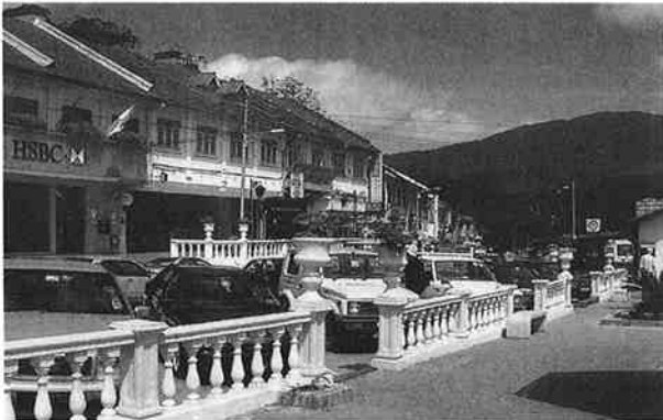
高原の中心、タラナタの町並み