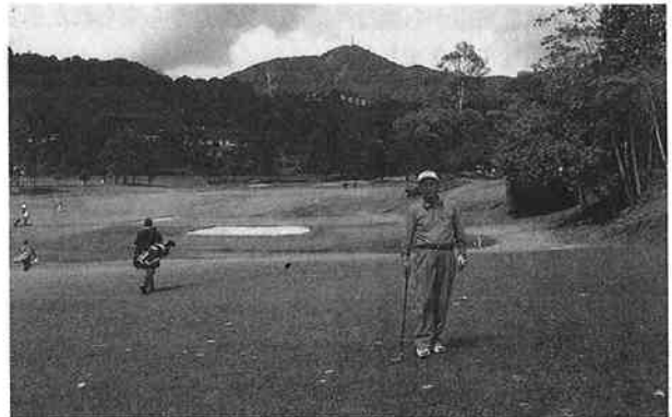
フラットで快適なゴルフコース

「リタイアした後は、のんびりと海外のロングステイを楽しみたい」、こんな思いからオーストラリア・カナダ・トルコ・スイス・イタリア・ハワイなどに夫婦で旅してきました。